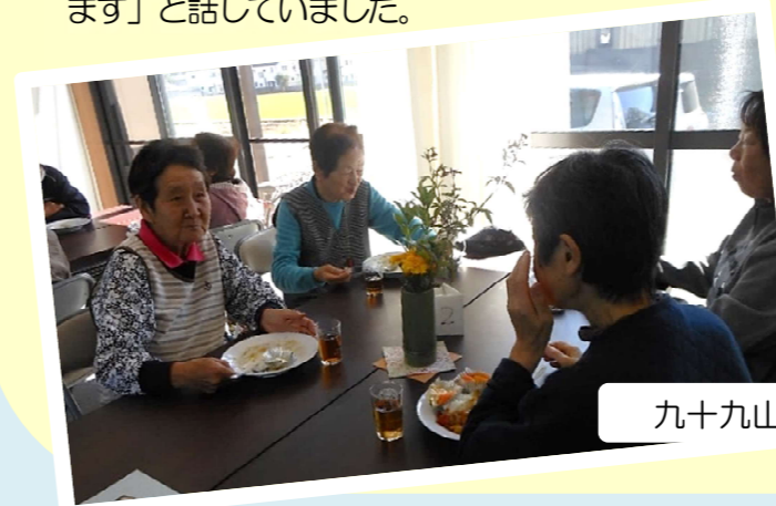
九十九山食堂の様子

町社協は、「地域住民の交流・見守り・支え合い」を進める住民主体の組織です。原西自治会では、令和5年4月から町社協の取り組みとして、「原西支え合いの輪」を設立、活動を始めました。名称には、「地域全体で輪のようになって、支え合っていこう」という思いが込められています。原西支え合いの輪の活動の一つが、原西公民館を中心に地域の交流・居場所づくりを進める「コミュニティサロン」で、その一環として、10月22日(日)に「九十九山食堂」が実施されました。当日のメニューは、住民有志(九十九山食堂を実施する会)が腕を振ったカレーライスで、多くの方が訪れ、大人も子どももみんなで賑やかに食事をし、おしゃべりしながらくつろいだ一時を過ごしていました。役員さんは、「この取り組みにより、支え合いの輪が広がっていくことを期待しています」と話していました。