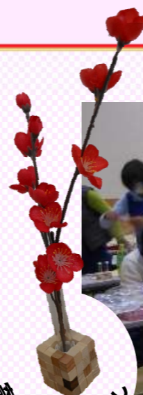
奇木細工の一輪挿し