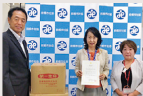
第一生命労働組合群馬支部様