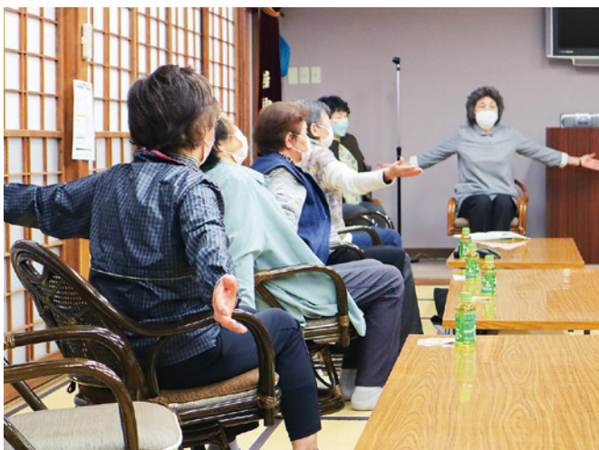
岩神町二丁目 ビンシャン体操