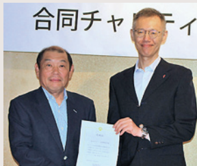
あかぎクラブ前橋地区様