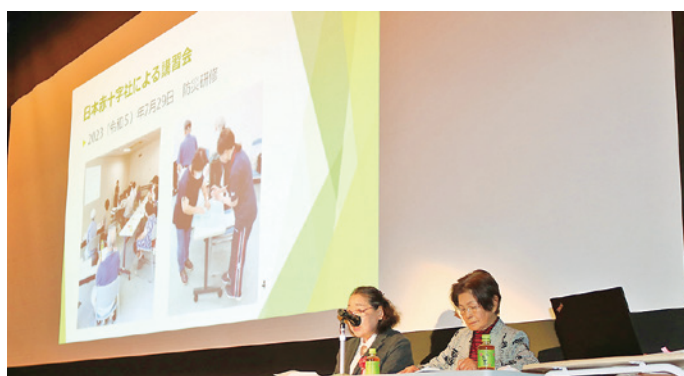
前橋市ボランティア団体連絡協議会さん

式典後には、長年前橋市のボランティア活動を先導してきた功績により前橋市長表彰を受賞した前橋市ボランティア団体連絡協議会による活動紹