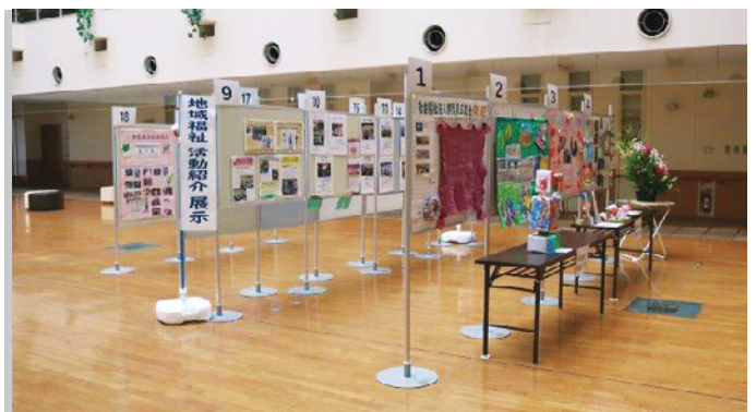
総合福祉会館では地域の福祉活動を紹介