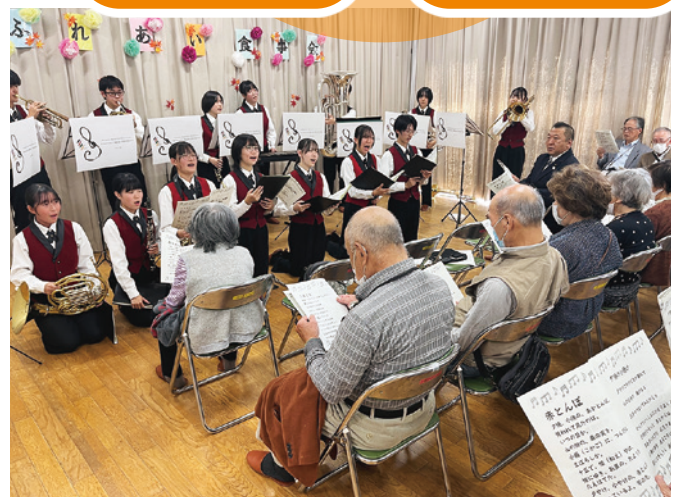
下細井町 市立前橋高校吹奏楽部との交流

前橋市社会福祉協議会は、町社協をはじめとした地域住民による支え合い活動・福祉の地域づくりを推進しています。多くの方々の地域福祉活動へのご協力・ご参加もお待ちしています。詳しくは地域福祉係までお問い合わせください。