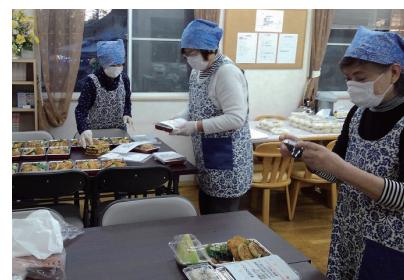
こまがたつくし様