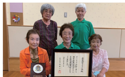
ボランティア会のみなさん

おもちゃの図書館びえろの運営ボランティアとしてもご協力いただいている若宮地区ボランティアの会のみなさんが、長年のボランティア活動を評され、群馬県総合表彰を授与されました。おめでとうございます。