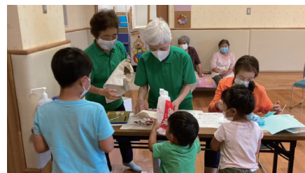
ボランティアによるプレゼント配布

今後も、運営ボランティアの方々と相談をしながら、おもちゃの貸出し等、コロナ禍でも開催可能な笑顔あふれるおもちゃの図書館を目指していきます。