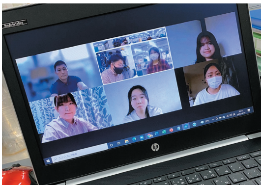
インターネットを利用した交流会

(安心カードとは、急病等もしもの出来事に備えた便利なカードです。) 詳しくは本会ホームページをご覧ください。