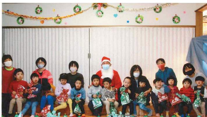
チャイルドハウスゆうゆう クリスマス会の様子