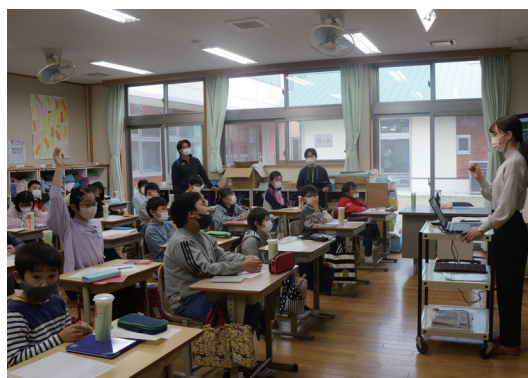
粕川小学校での安心カードのデザインづくり

(安心カードとは、急病等もしもの出来事に備えた便利なカードです。) 詳しくは本会ホームページをご覧ください。