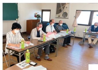
元総社町10区社協 設立総会の様子