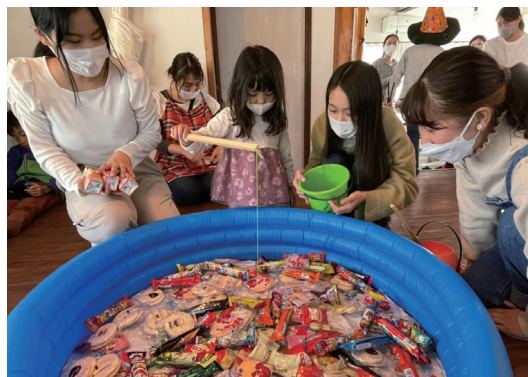
交流会を経て、ボランティア活動に 繋がりました。