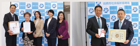
一般社団法人前橋法人会女性部会様 あいおいニッセイ同和損害保険株式会社 MS & AD ゆにぞんスマイルクラブ様