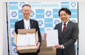
共愛学園賛助会様

次の方から合計19.30kgのプルタブ・アルミ缶をいただきました。 下長磯町老人クラブ／文京町二丁目天寿会／株式会社あらたや／ 東箱田後家町囲碁クラブ／朝日野ボランティア