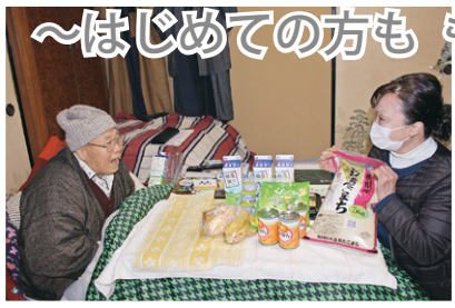
～生活支援ボランティア(買い物代行)の様子～