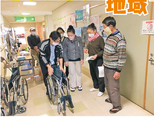
みんなのフェスタにて

11月19日、「株式会社LIXILトータルサービス」の職員にご協力いただき、「福祉教育サポートボランティア研修会」を開催しました。