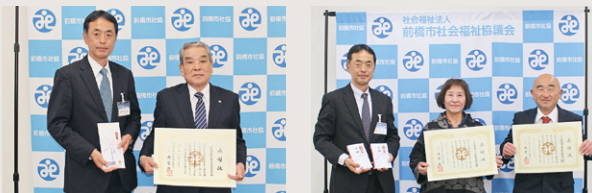
上川湖地区民生委員 児童委員協議会 様