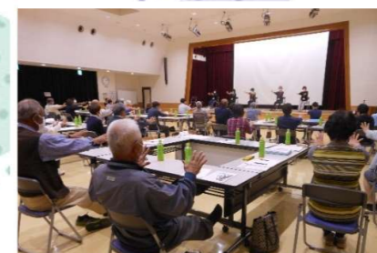
皆でピンジャン!元気体操

前半は、新地サロンの担い手さんからコロナ禍でのサロンの様子を聞いたり、介護予防サポーターさんが講師となり、ピンジャン!元気体操を行いました。後半は、6~7人に分かれグループワークを行いながら、各々情報交換を行いました。