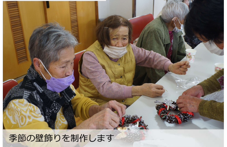
季節の壁飾りを制作します