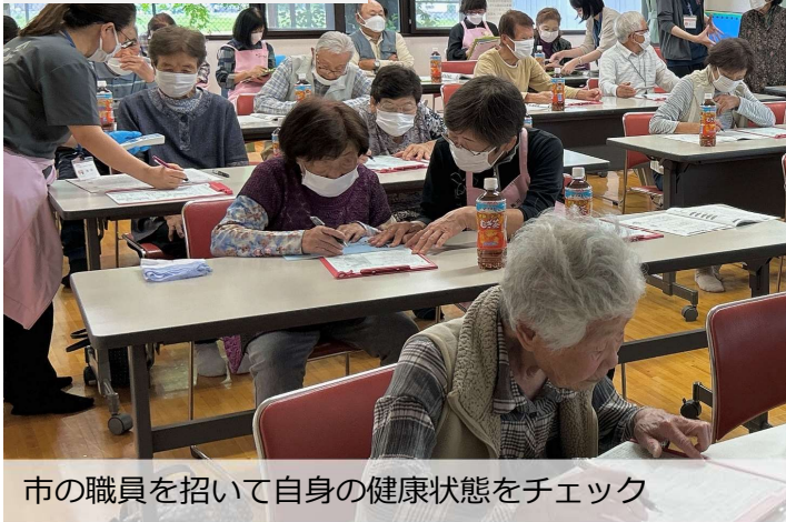
市の職員を招いて自身の健康状態をチェック