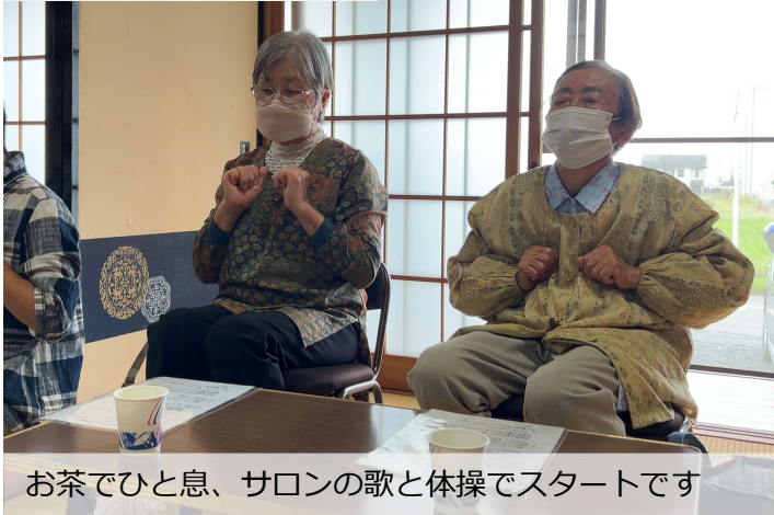
お茶でひと息、サロンの歌と体操でスタートです