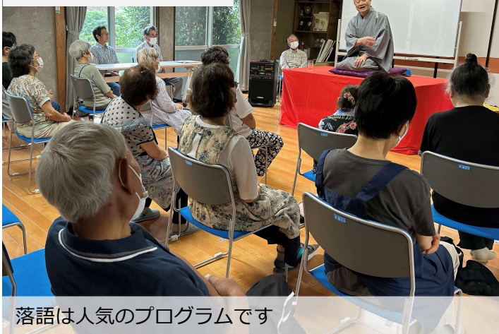
落語は人気のプログラムです