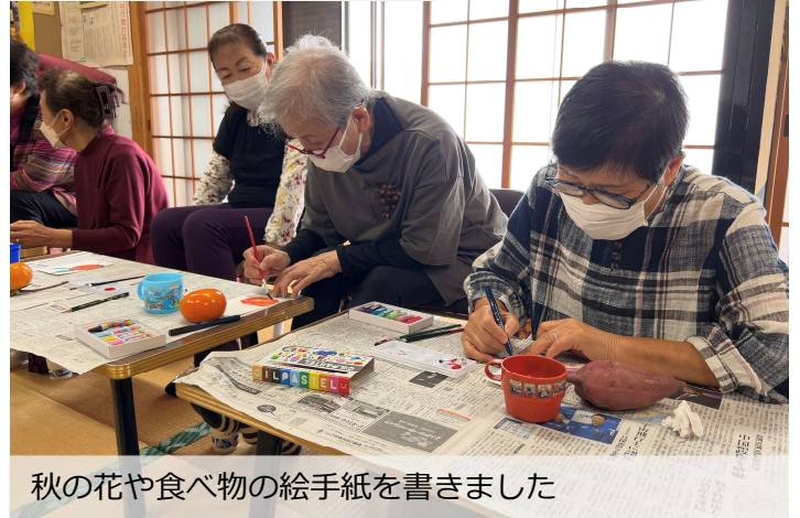
秋の花や食べ物の絵手紙を書きました