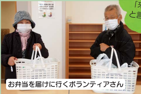
お弁当を届けに行くボランティアさん

コロナ禍においても、地域では様々な工夫を取り入れた福祉活動が取り組まれています。最大限に感染症予防対策をした、つながりを切らない活動を紹介します。