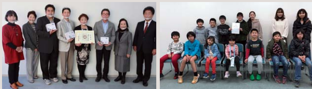
一般社団法人 前橋法人会 女性部会様