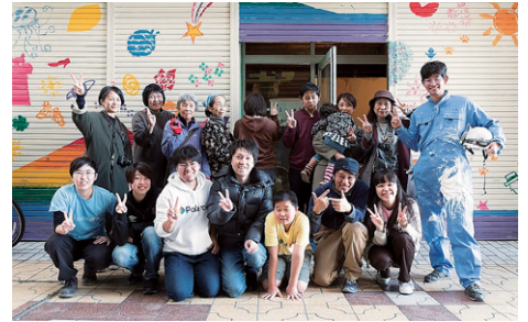
事業配分を活用する団体：ハレルワ

問い合わせ：共同募金会前橋市支会 ボランティアセンター ☎027-232-3848