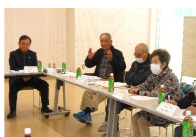
④町社協代表者会議の様子