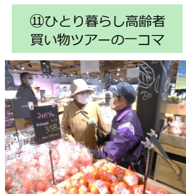
⑪ひとり暮らし高齢者買い物ツアーの一コマ