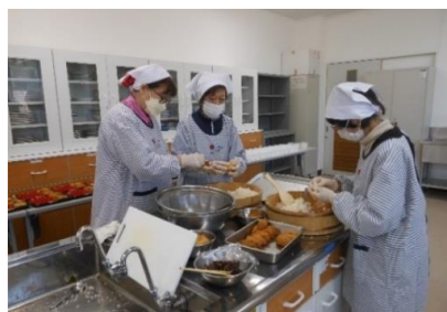
⑩ひとり暮らし高齢者給食サービスの調理風景