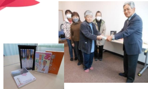
【赤十字奉仕団 寄付金贈呈の様子】

富士見地区のために、善意の寄付をお預かりしました。 社会福祉のために、大切に活用させていただきます。