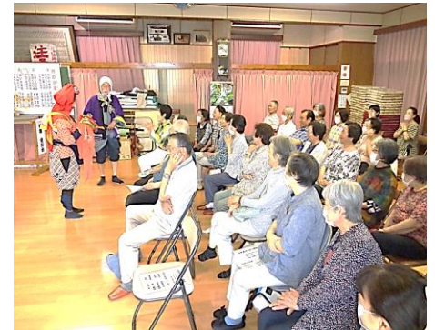
6/21向町サロン ふれあい寄席