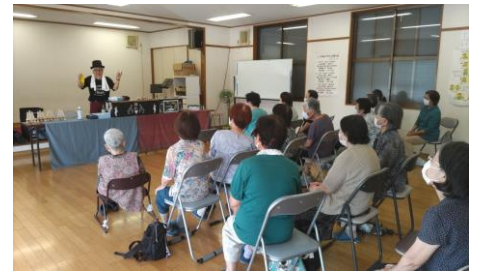
6/19下町サロン マジックショー