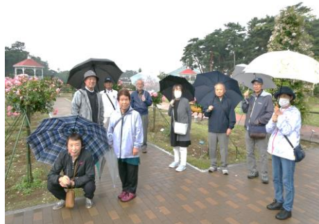
6/3横沢サロン バラ園散策