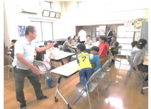
6/8上大屋町サロン 多世代交流