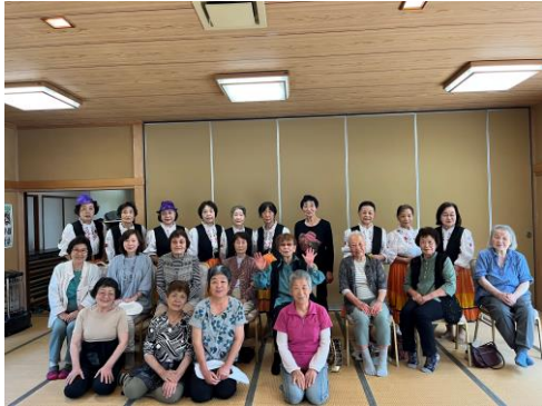
5/20滝窪白草サロン フォークダンスを楽しみました。