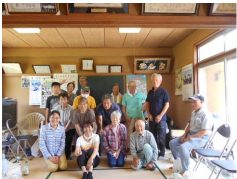
6/21一丁田サロン レクリエーション 5/29茂木天神サロン 手芸等