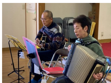
12/19 大胡町下町サロン ギターとアコーディオンに合わせて歌を楽しみました