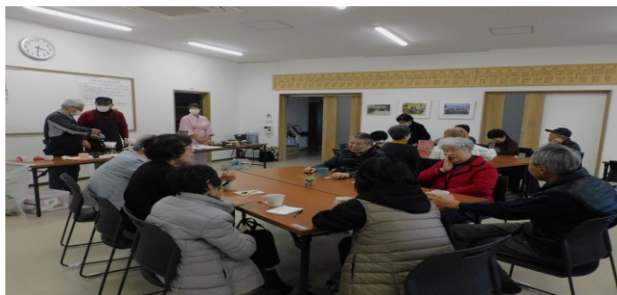
11/29 堀越町公民館カフェ