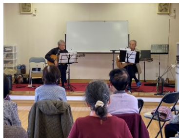
11/23 大胡町下町サロン 芸能発表会を楽しみました