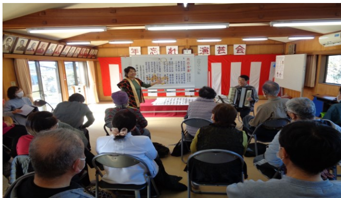
12/9 茂木町4地区合同サロン ふれあい寄席を楽しみました。