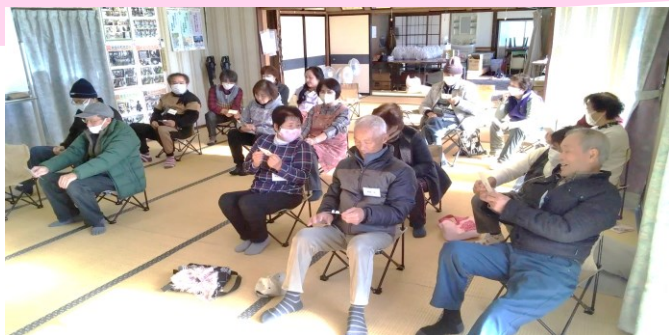
12/15東金丸町サロン ビンゴゲームを楽しみました