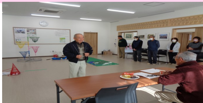
12/8 堀越町尾引サロン シャッフルゴルフとフラワー玉入れを楽しみました