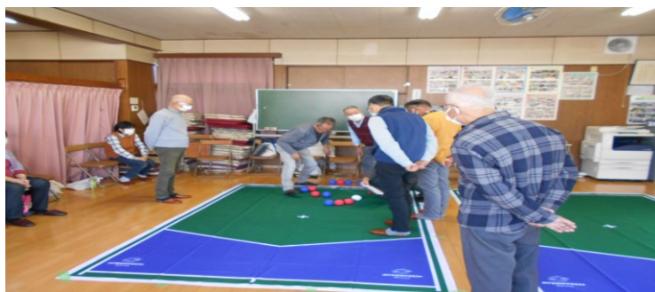
12/22 向町サロン（向屋敷）ポッチャを楽しみました