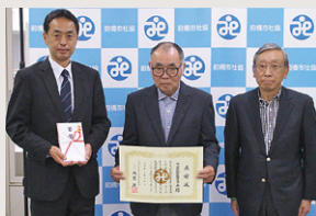
下川淵地区民生友の会様