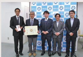
前橋北ロータリークラブ様