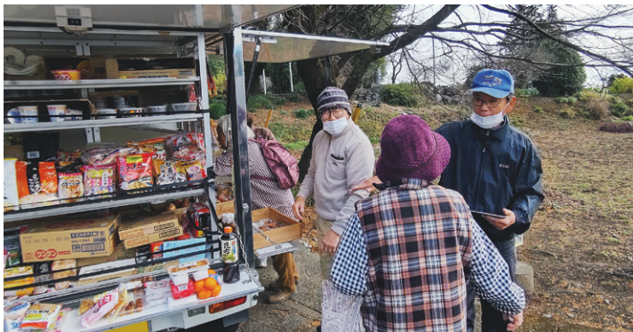
特定非営利活動法人 つなぎ手 買い物弱者支援事業