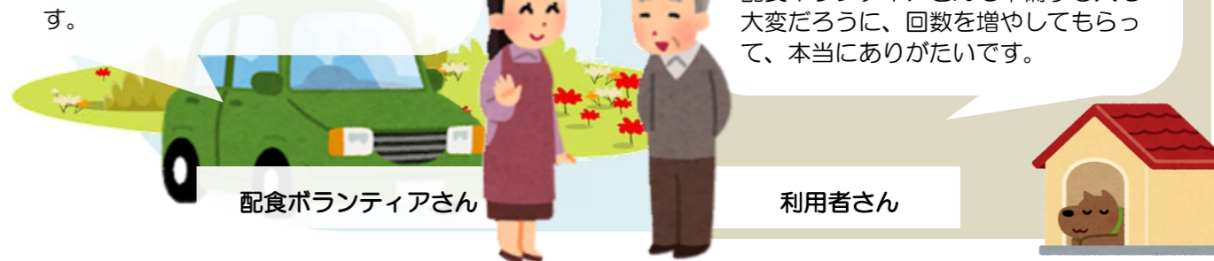
配食ボランティアさん