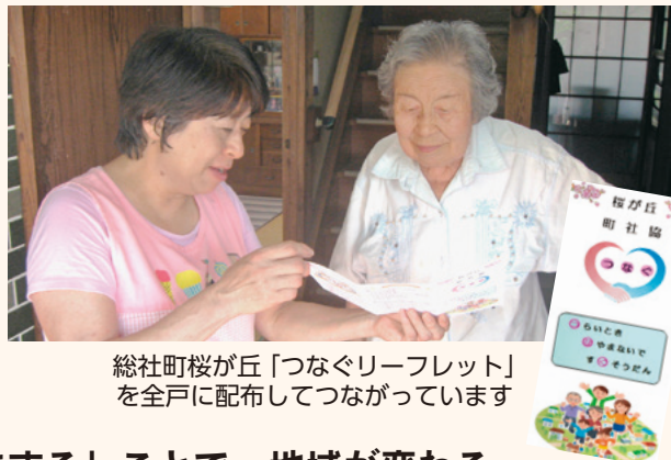
総社町桜が丘「つなぐリーフレット」を全戸に配布してつながっています

「地域共生社会」は特別なことではなく、毎日の挨拶や顔見知りを増やすことなど、私たちの日常の延長線上にあるのです。