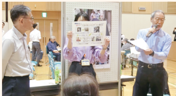
町社協活動情報交換会の様子

他の地域の取り組みを知ることは、私たちの町を見つめ直すきっかけになります。「隣町でやっていた」「私たちの町ならどうだろう?」と会話を広げてみてください。こうした情報の共有と会話の積み重ねこそが、地域共生へとつながります。