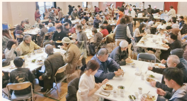
様々な人が参加する岩神地区カレー食堂

町を面白くする主役は、あなたの「やってみたい!」という気持ちです。ぜひ、地域共生フォーラムで、あなたらしい一歩を踏み出すヒントを見つけませんか。