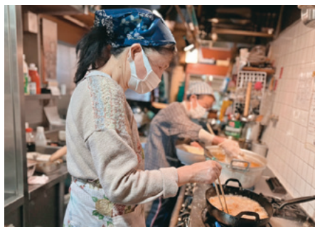
募金を活用し、子ども食堂にて食事を提供いたしました。ボランティアによる手作り料理は利用者の方々に好評で、温かい団らの場となりました。(一般社団法人スリージェネレーションズ)