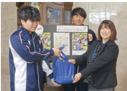
市内の小中学校、高校、大学、企業、団体から、たくさんの募金が寄せられました。(群馬医療福祉大学)