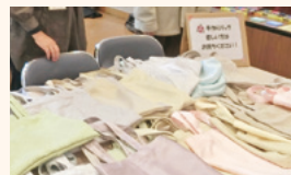
80代の方が趣味でつくった手提げ袋が大好評

12月26日には、200名の方が参加されました。また、当日参加できなくても、自分の趣味を活かして関わることができ、多様なつながりが生まれています。