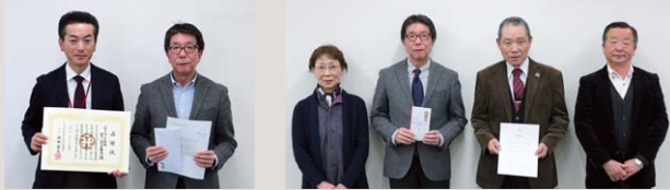
けやきウォーク前橋 愛の一円玉募金様